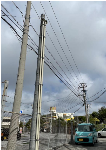
局舎電柱側引き込み