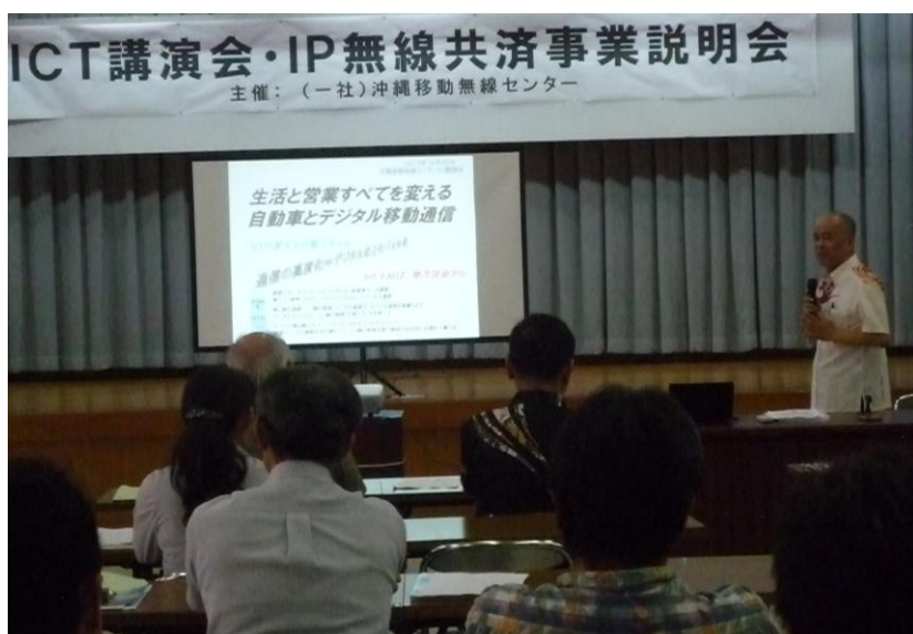
岡崎全自無連専務理事