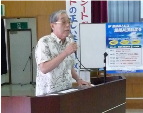
島袋副会長の開会のあいさつ